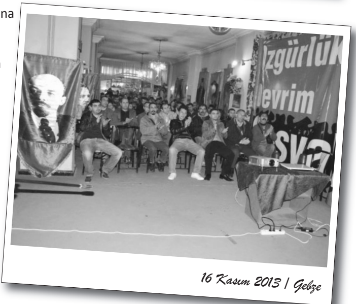
16 Kasım 2013 | Gebze